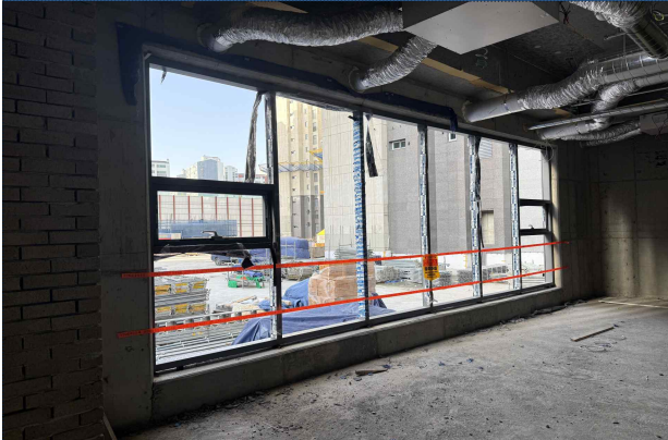
부속동 외부창호 설치